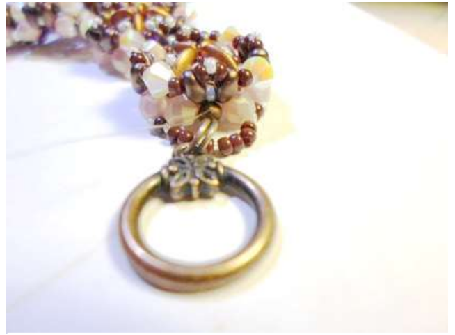
14. Fűzz akasztórészt a karkötő mindkét végére úgy, hogy a két csiszi közé fűzz be

1 db 3mm golyót (ahová eddig a MobyDuokat fűztük) a golyóra raw technikával fűzz 7 db 11/o kását és szerelőkarikát majd menj körbe többször.