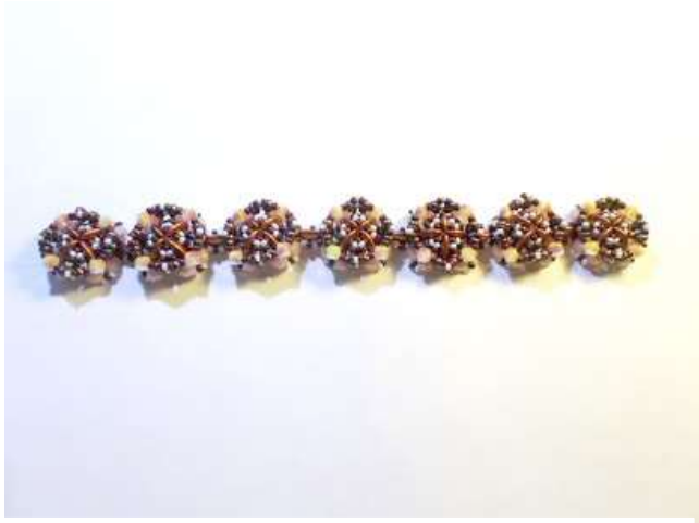
13. Ilyen, ha összefűzted az elemeket.